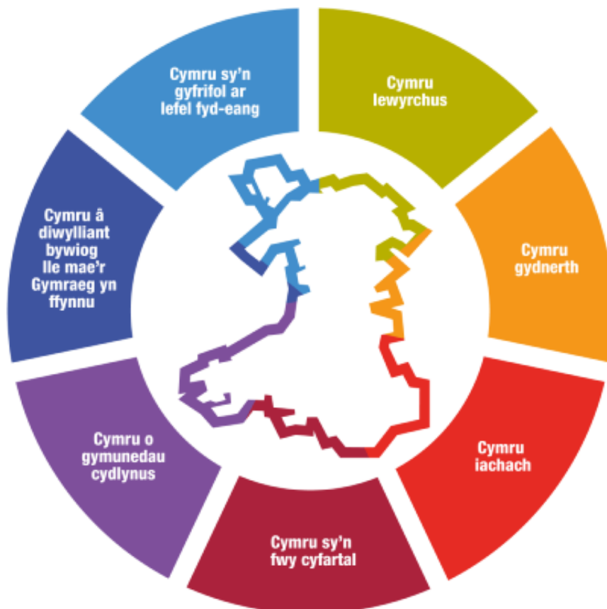
Ffigur 1: Nodau Llesiant a sefydlwyd gan Ddeddf Llesiant Cenedlaethau'r Dyfodol (Cymru) 2015