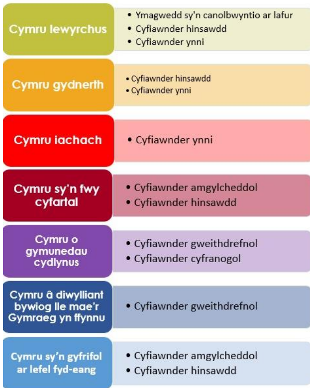
Ffigur 2: Nodau llesiant a'u hymagweddau aliniol

llesiant yn golygu na ddylai nodau hinsawdd a llesiant 'gael eu dilyn ar wahân i'w gilydd' (OECD, 2019: 11).